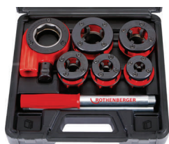
Sada 7.0790X Sada 7.0780X